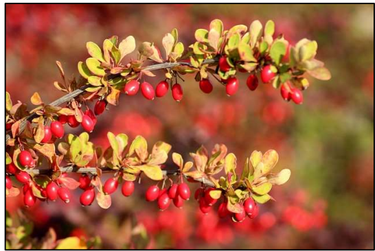
Bild: Berberitze mit Früchten