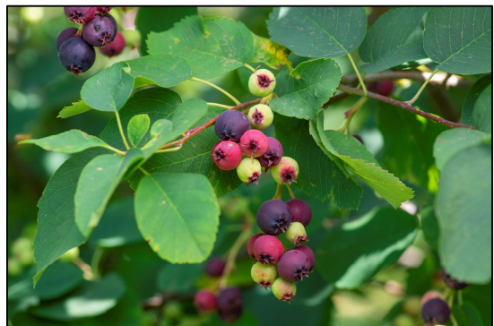
Bild: Felsenbirne