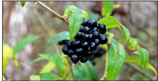
Bild: Liguster mit Früchten