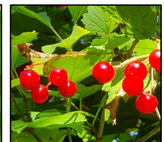
Bilder: Gemeiner Schneeball